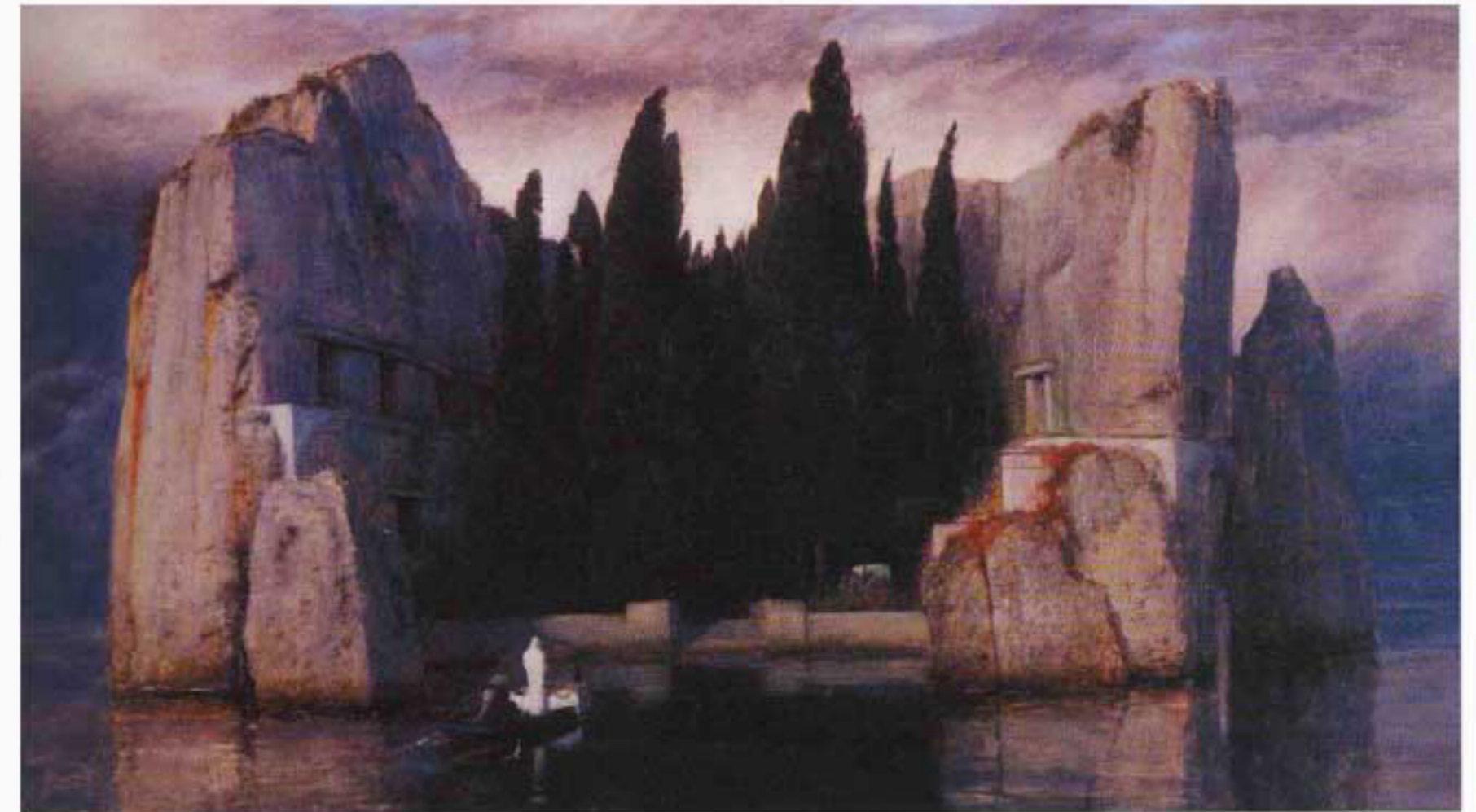
Arnold Böcklin, Die Toteninsel (1883)