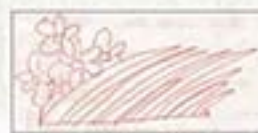
Vase Yoshie, Japan