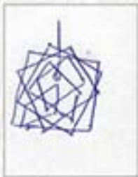
Aluminium Objekt Larissa, St. Petersburg

Zeichne ein Jugendstil Ornament aus Pflanzen Motiven oder aus geometrischen Teilen.