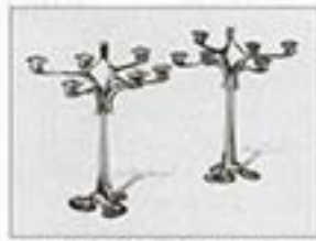
Henry van de Velde, Kandelaberpaar 1898/99

Das Kandelaberpaar von Henry van de Velde: Es gehört Dir. Zu welcher Gelegenheit benutzt du es?