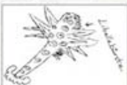
Libellenbürste Shana, Arizona