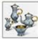
Kaffee-und-Tea-Service Lucien Bohnstedt 1890